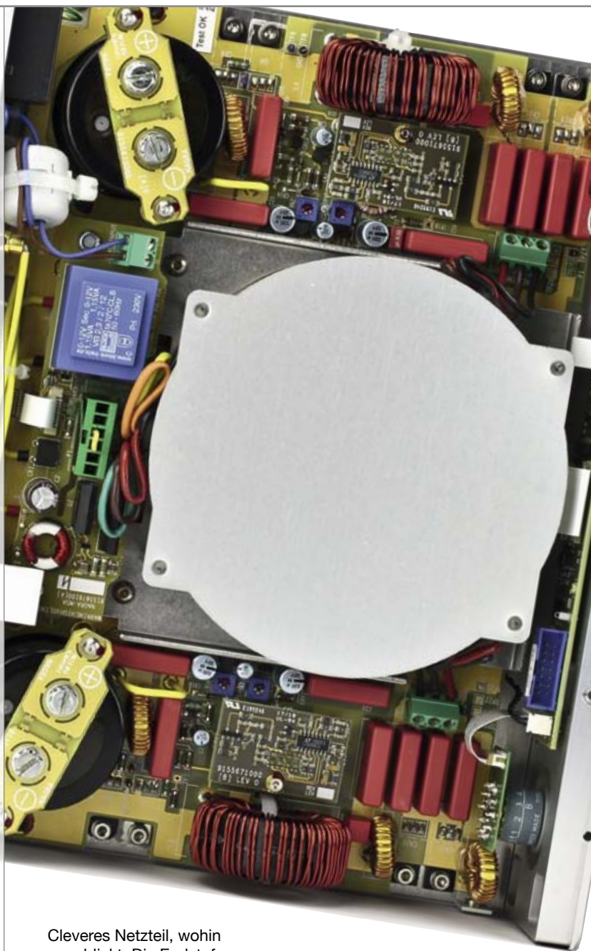
Cleveres Netzteil, wohin man blickt. Die Endstufe steckt unter dem Trafo

Unterschiede finden sich vor allem in der Wahl der verstärkenden Elemente – aufwendige Röhrenschaltungen in der Jazz vs. kostengünstigere