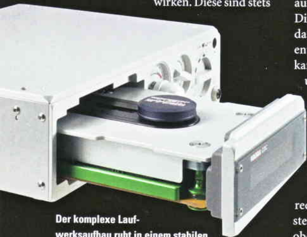
Der komplexe Laufwerksaufbau ruht in einem stabilen Schubladenmechanismus. Der Philips-Drive wurde definiert schwingend gelagert

Vom DAC aus geht's dann unmittelbar zu per Drehknöpfe oder Fernbedienung regelbaren, mittels höchstwertiger Alps-Potis realisierten Einstellmöglichkeiten für Lautstärke- und Balance, die auch auf den hervorragend klingenden Kopfhörerverstärker wirken. Diese sind stets